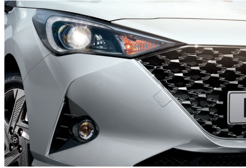
Dải đèn LED ban ngày DRL