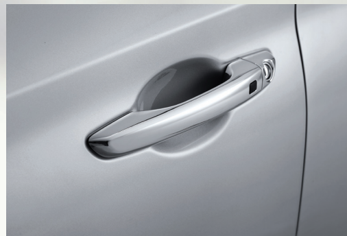
Tay nắm cửa mạ Crom