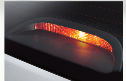
Đèn báo phanh trên cao