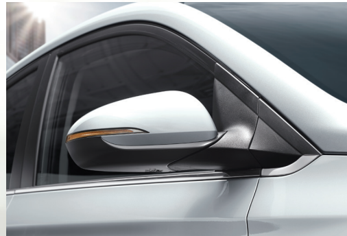
Đèn báo rẽ LED tích hợp trên gương