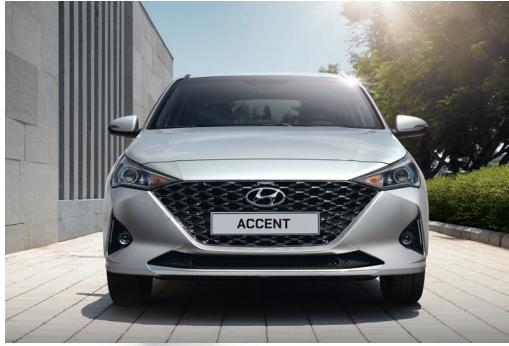
Thiết kế lưới tản nhiệt mạ crôm đen kết hợp các khối hình đan xen nhau

Thiết kế mới của Hyundai Accent là một cuộc cách mạng, đem đến vẻ đẹp hấp dẫn của sự kết hợp giữa hiện tại và tương lai. Lưới tản nhiệt bắt mắt với các khối hình đan xen, táo bạo và lớp mạ crôm tạo nên sự cao cấp. Đèn định vị LED với hệ thống chiếu sáng projector giúp bạn quan sát rõ hơn vào ban đêm đồng thời mang đến nét tinh tế công nghệ cao.