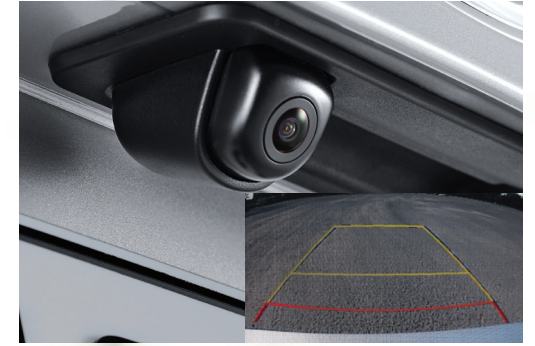
Camera lùi, kết hợp với cảm biến sau xe