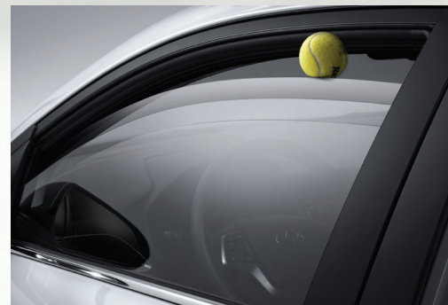
Cửa sổ chỉnh điện chống kẹt