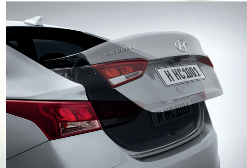
Cổp mở thông minh khi chia khóa đến gần