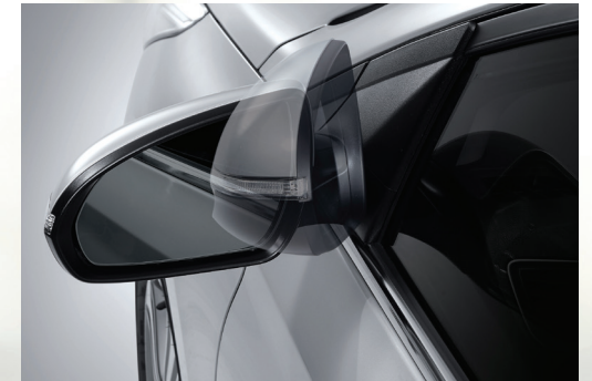
Gương chiếu hậu gập chỉnh điện