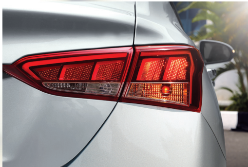
Đèn hậu công nghệ LED 3D