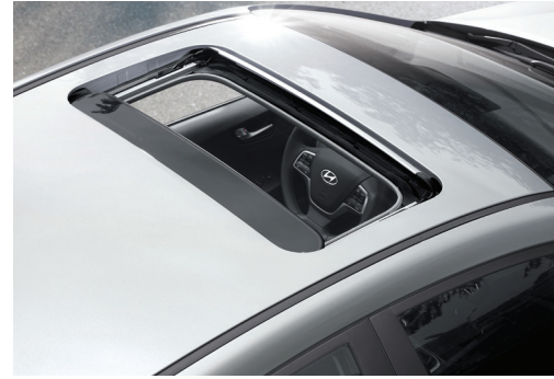
Cửa sổ trời điều khiển điện (Với phiên bản AT Đặc Biệt)