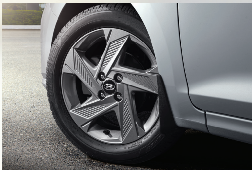
Lazang hợp kim 16 inch (Với phiên bản AT Đặc Biệt)